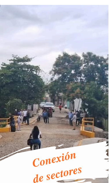
Conexión de sectores