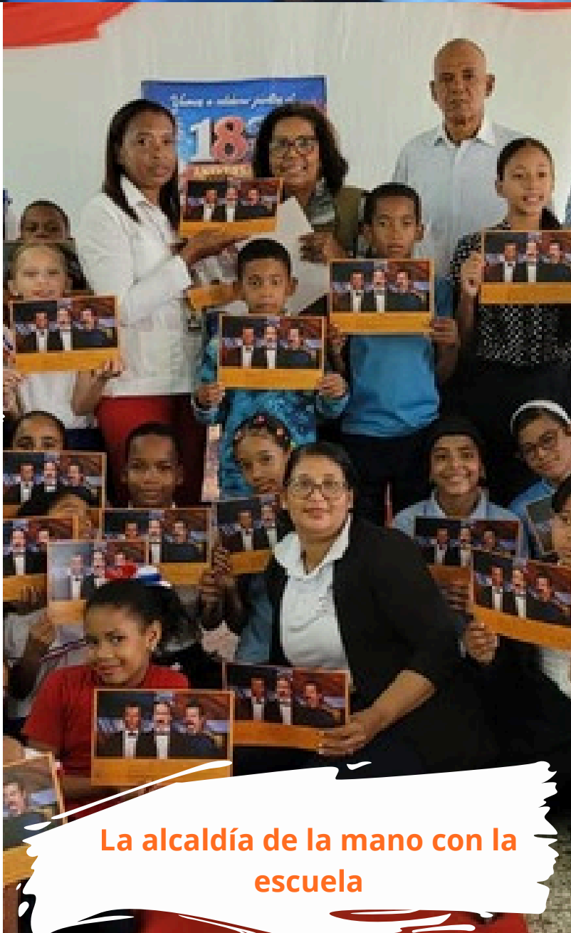
La alcaldía de la mano con la escuela