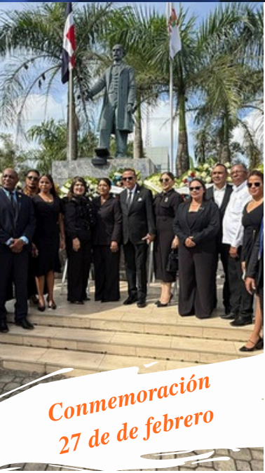
Conmemoración 27 de de febrero