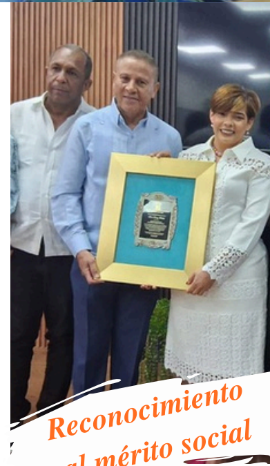
Reconocimiento al mérito social